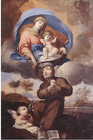
Jungfru Maria ger skapularet åt den helige Simon

ria? Varför? Kanske är den viktigaste läran vi kan dra ifrån Fatima budskapet att det mänskliga livet bär på ett stort allvar och att det finns ett omedelbart behov för att be och att gottgöra.