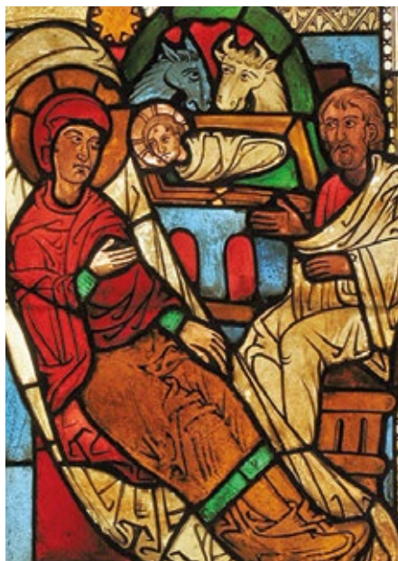
Glasmålning från 1200-talet i Sjonhems kyrka.