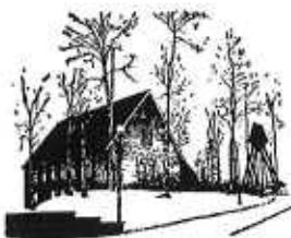
S:t Andreas kyrka